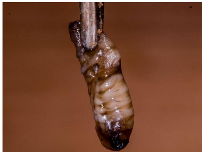
Prénympe morte avec accumulation de liquide

(rouge: cellules entièrement désoperculées prêtes à être vidées – deux flèches en haut à gauche : risque de confusion avec la loque européenne ; bleu: opercules déchirés en début de désoperculation)