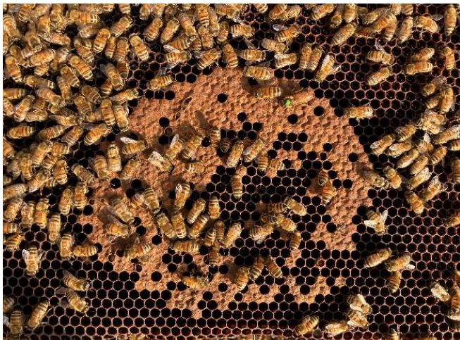
Image 1 : Non visible, mais néanmoins présent : abeilles fortement contaminées par le DWV (virus des ailes déformées) ; En revanche, bien reconnaissables : opercules en partie affaissés et troués à la suite de la varroase.