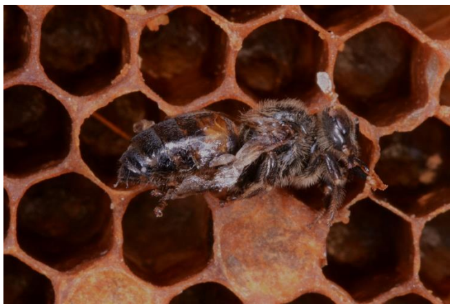
Image 2 : Des abeilles malades se développent dans les cellules aux opercules affaissés. Sur la photo, une abeille aux ailes déformées.